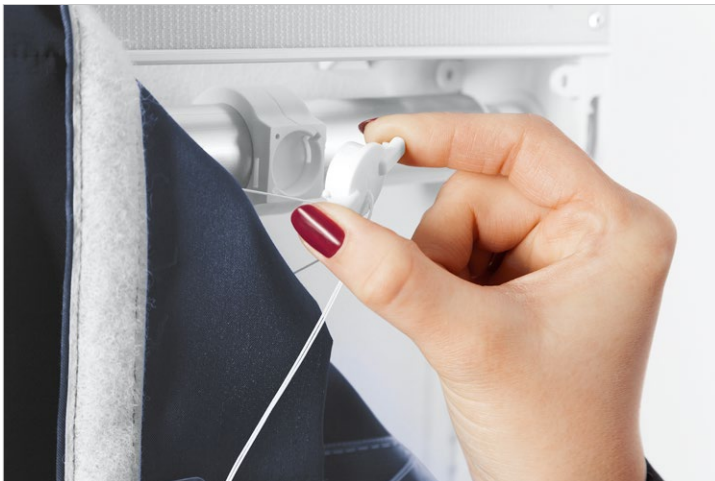
Einfache Abnahme bzw. Befestigung des Schnursammlers